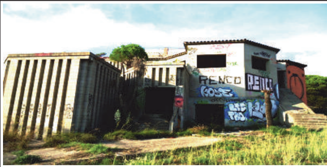
Imagen de la posible ubicación del crematorio. Antigua discoteca Pacha en la carretera de Blanes

ICV-EUiA propone ubicarlo al lado del futuro cementerio.