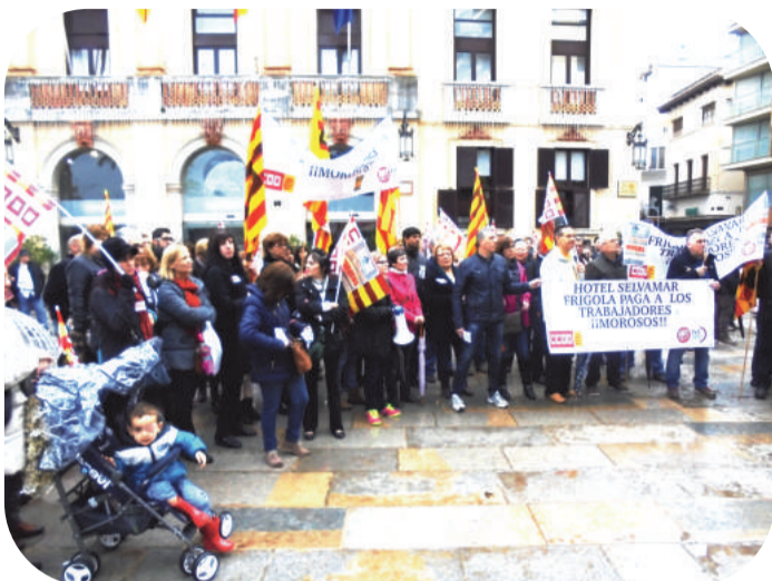
Aspecto de la movilización de los trabajadores del hotel Selvamar en defensa de sus salarios

La empresa cierra las puertas debiendo dinero a los trabajadores.